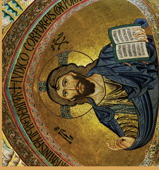
Christo Pantocratore, Duomo di Cefalù (Palermo)

I TEMPI FORTI DELLO SPIRITO NELLA PASTORALE DELLA CHIESA